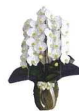
胡蝶蘭 16,500円 友の会値引き対象外

〒863-0022 天草市栄町6-17 有限会社 大佛堂 0969-23-5969 〒863-0001 天草市本渡町広瀬465の2 大佛堂直営 天壽殿 0969-22-0002 〒861-7314 天草市有明町大島子2841-1 ありあけ天壽殿 0969-52-0080 Fax 0969-24-2526