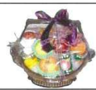
果物籠・果物缶詰籠 5,400円 10,800円 友の会値引き対象外