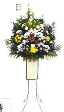
1番 生花1段16,500円 (高さ 180cm)