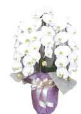
胡蝶蘭 22,000円 友の会値引き対象外