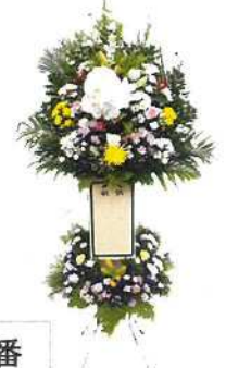
2番 生花2段22,000円 (高さ 180cm)