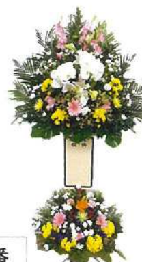
3番 生花2段27,500円 (高さ 210cm)